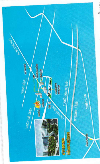
แผนที่... ศูนย์บริการขอระบบการชำระหนี้ขอระบบ